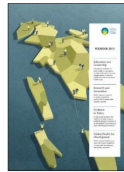
WHS Yearbook 2013

WHS Yearbooks have received various awards for content and design, including: