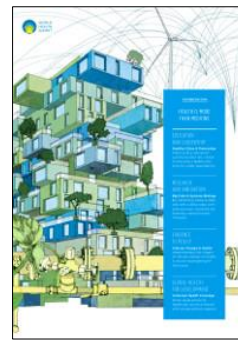
WHS Yearbook 2014