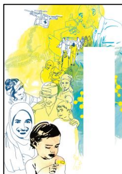
WHS Yearbook 2016 (not final cover)

Circulation: 5,000 printed copies & more than 20,000 digital copies