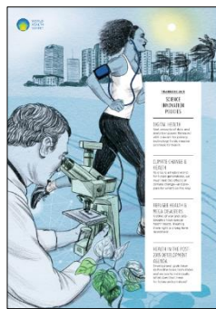
WHS Yearbook 2015